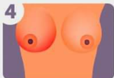
4 Rougeur, gonflement et chaleur de la peau